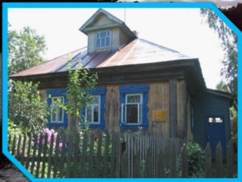
Дом в с. Владимирское