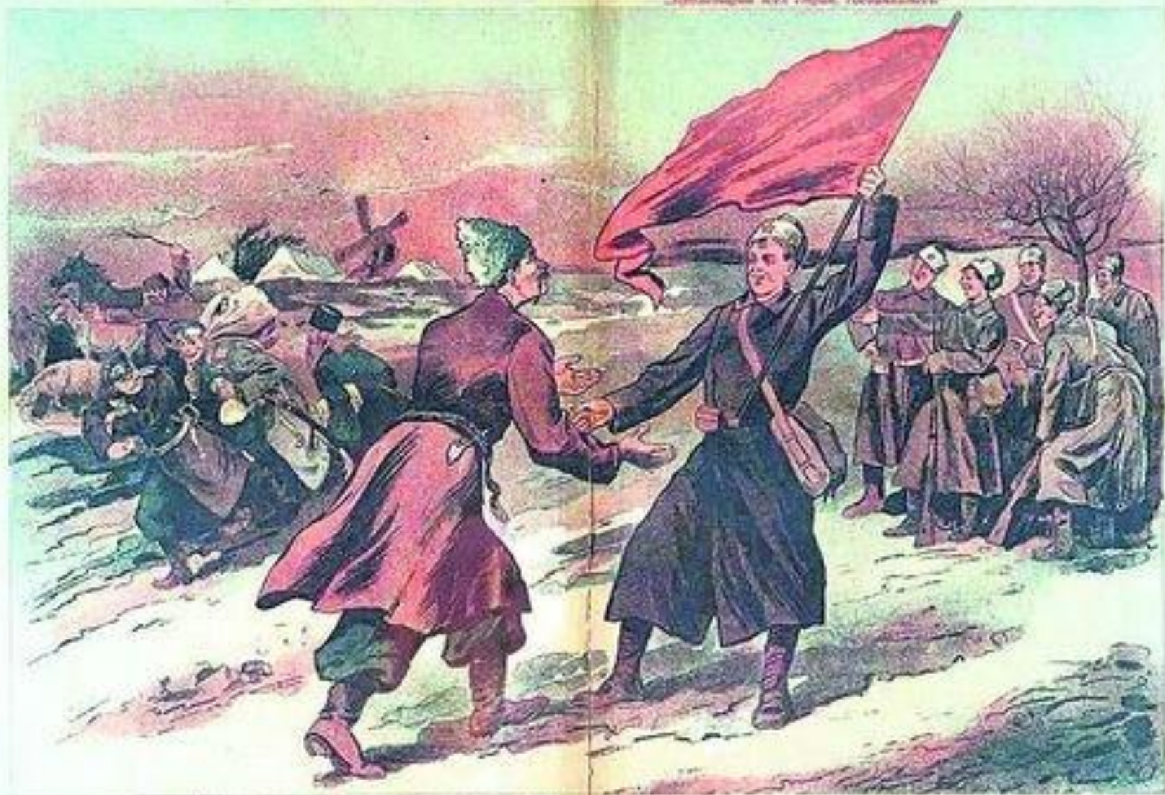
Украинская красная армия освобождает свой народ.