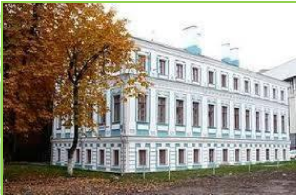
Дом-музей И. Никитина в Воронеже

Иван Саввич Никитин родился 21 сентября 1824 года в Воронеже. Отец его был торговцем - владел свечным заводом и лавкой.