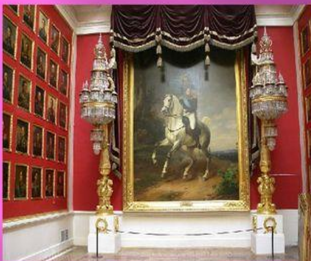
Зал триумфа над Францией.