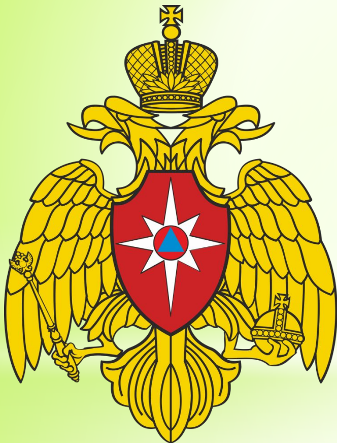
Эмблема МЧС России