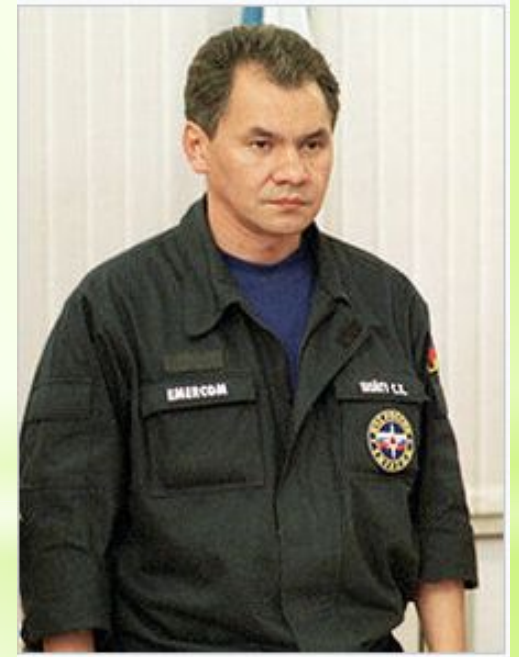
Первый руководитель МЧС Сергей Шойгу

Основная задача этой службы - осуществление мер по борьбе с катастрофами, стихийными бедствиями, эпидемиями, ликвидация их последствий.