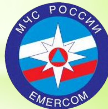
Логотип МЧС России