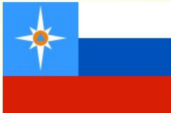
Флаг МЧС России