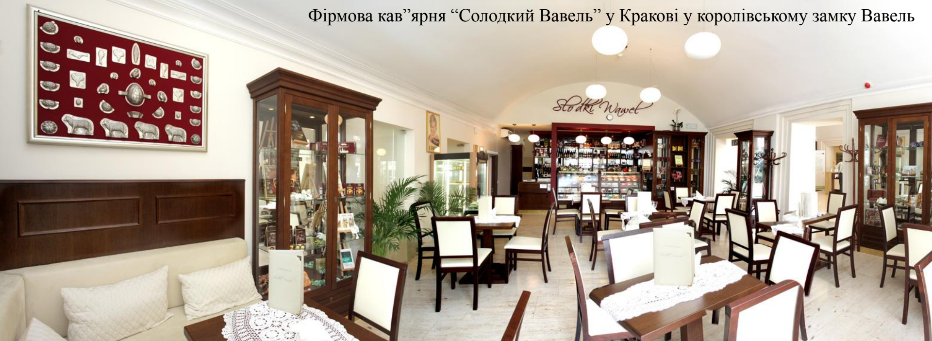
Фірмова кав'ярня "Солодкий Вавель" у Кракові у королівському замку Вавель