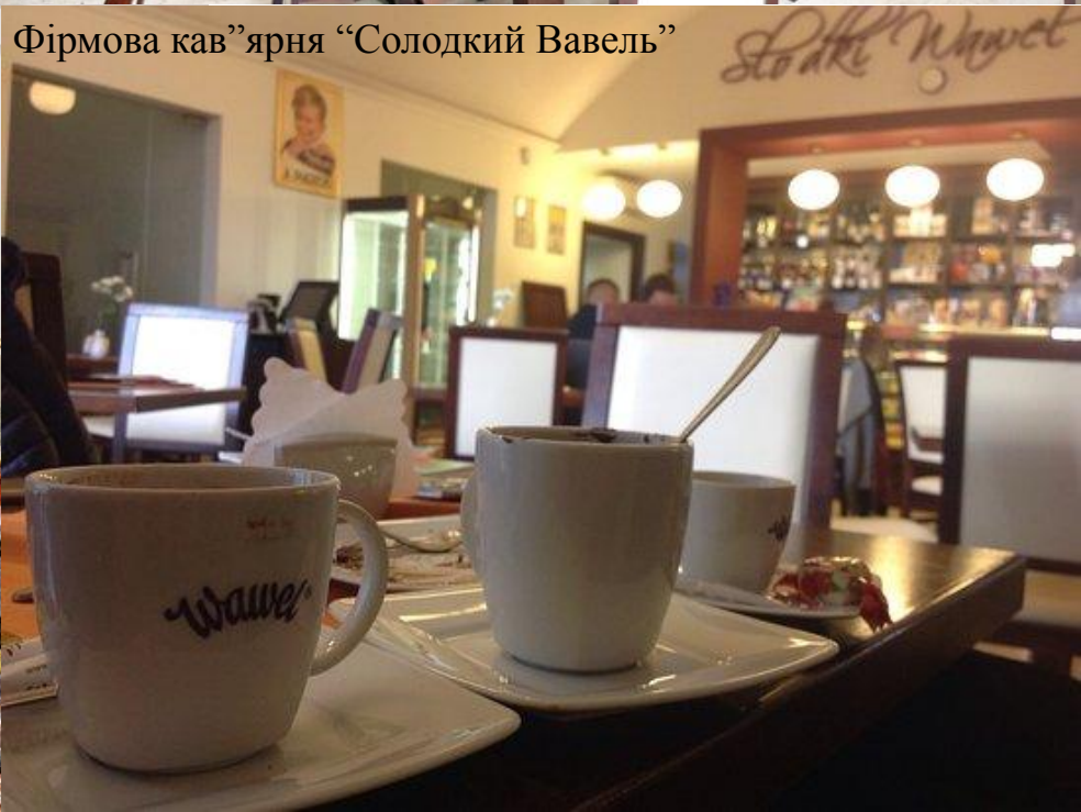
Фірмова кав'ярня "Солодкий Вавель"