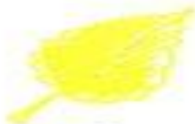
вот с берёзы золотой.