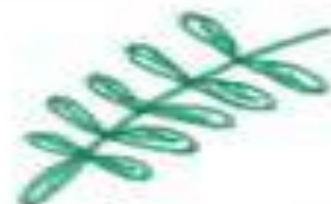
вот рябиновый резной,