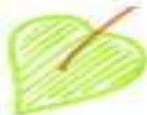
Вот последний лист