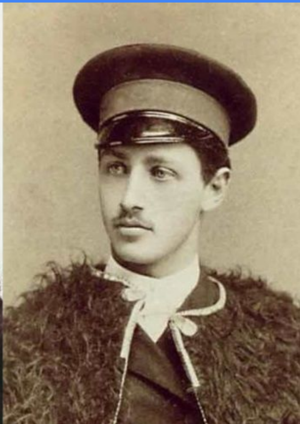
В. В. Пащенко, 1886. И. А. Бунин, 1890