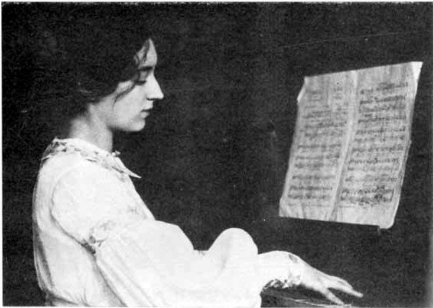
Вера Николаевна Бунина (Муромцева)