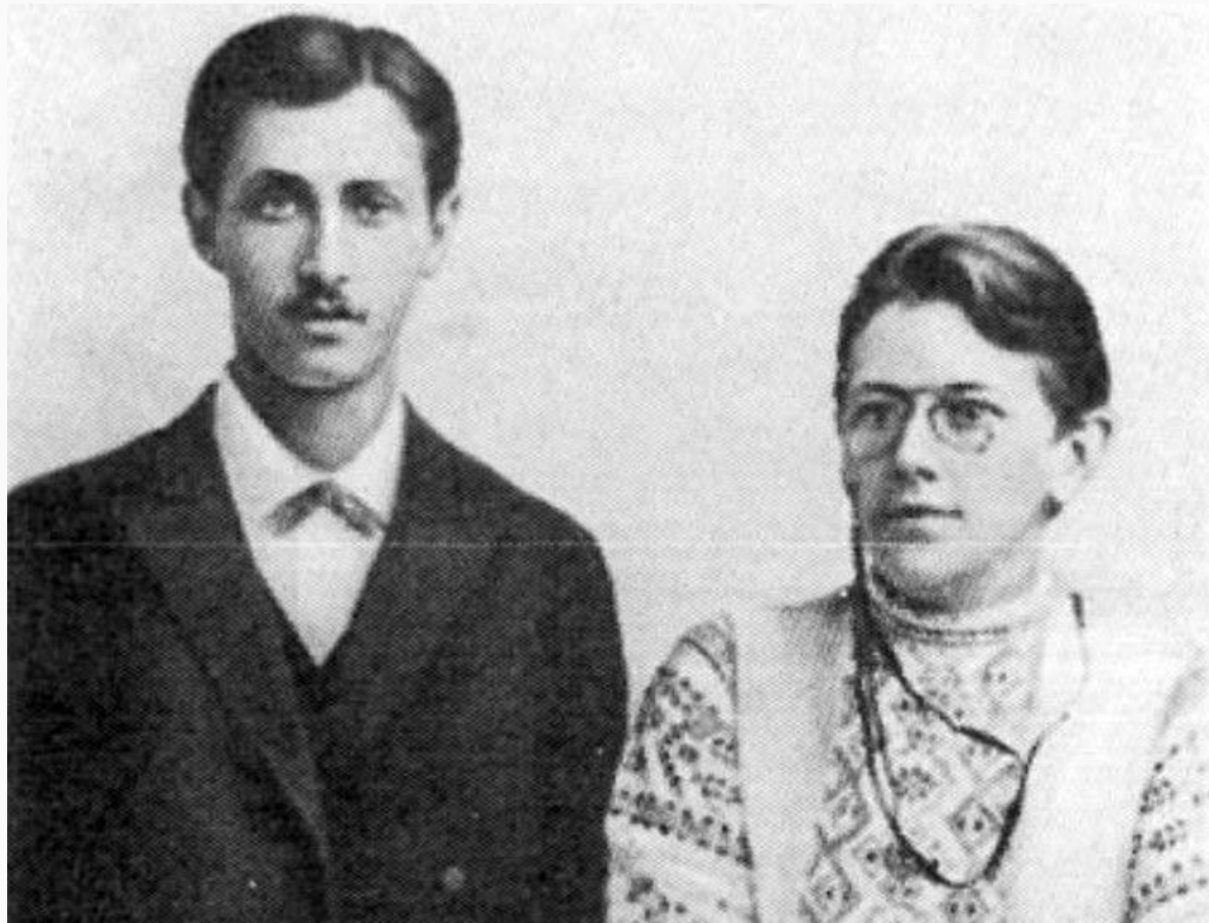
И. А. Бунин и В. В. Пащенко, 1892