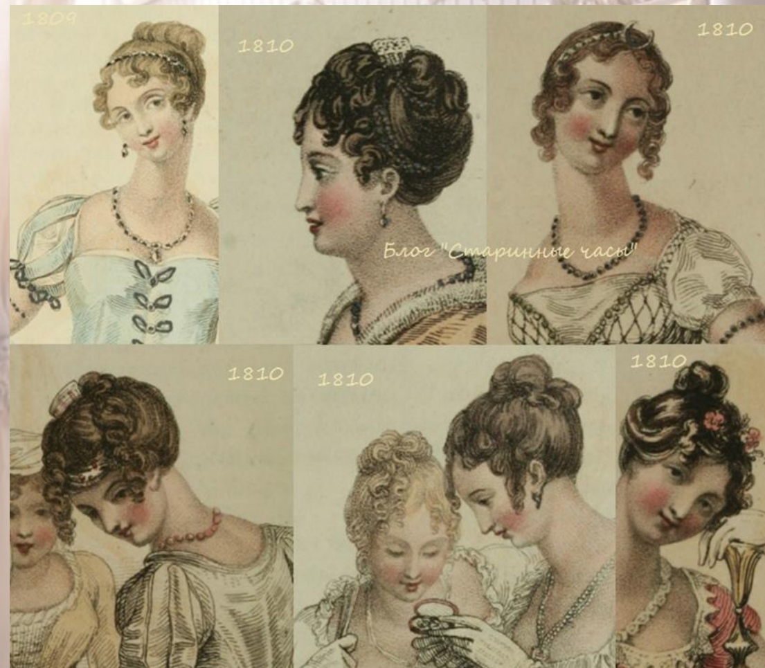
1810 год – локоны и узлы