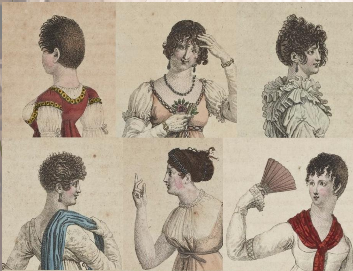
1803 год – женские СТРИЖКИ