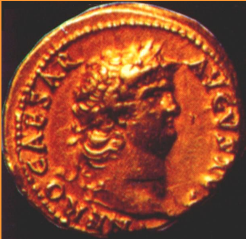
Древнеримская монета с изображением Нерона

В 1 в.н.э. Римская империя достигла вершины своего могущества.