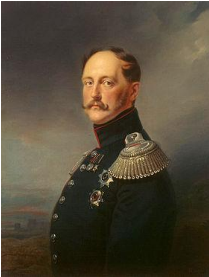
Николай 1 Павлович (1825-1855)

При Николае I предпринимались более жёсткие шаги: