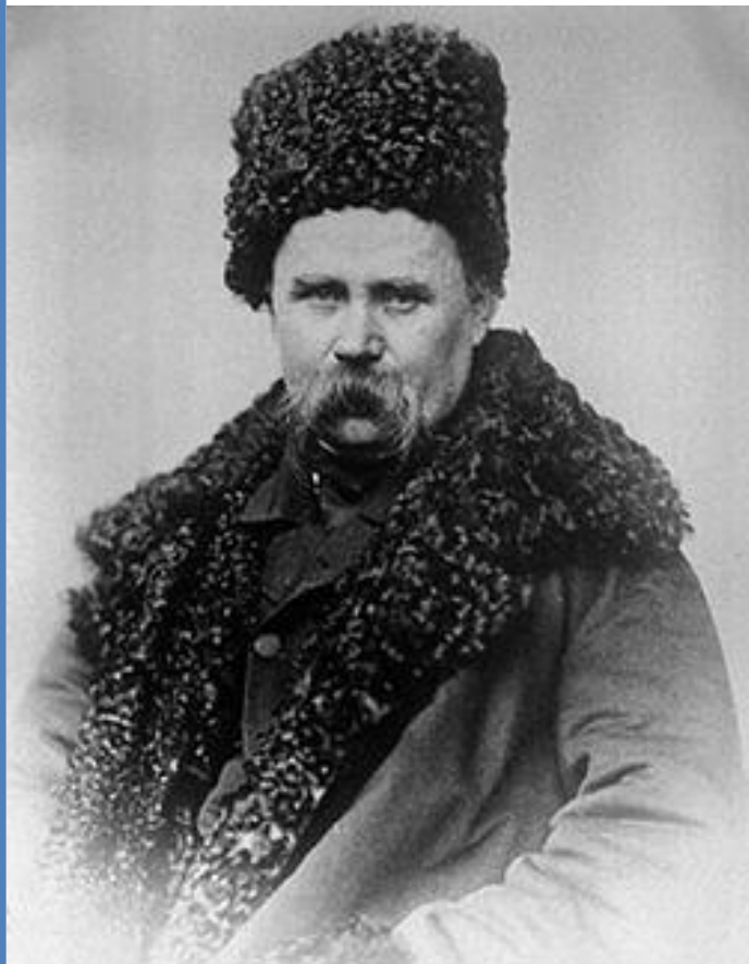
Шевченко Тарас Григорьевич (1814-1861)

Лидер Кирилло-Мефодиевского общества - поэт Т.Г. Шевченко, открыто призывавший к насильственному изменению положения дел на Украине, развитию обучения и изданию книг на украинском языке.