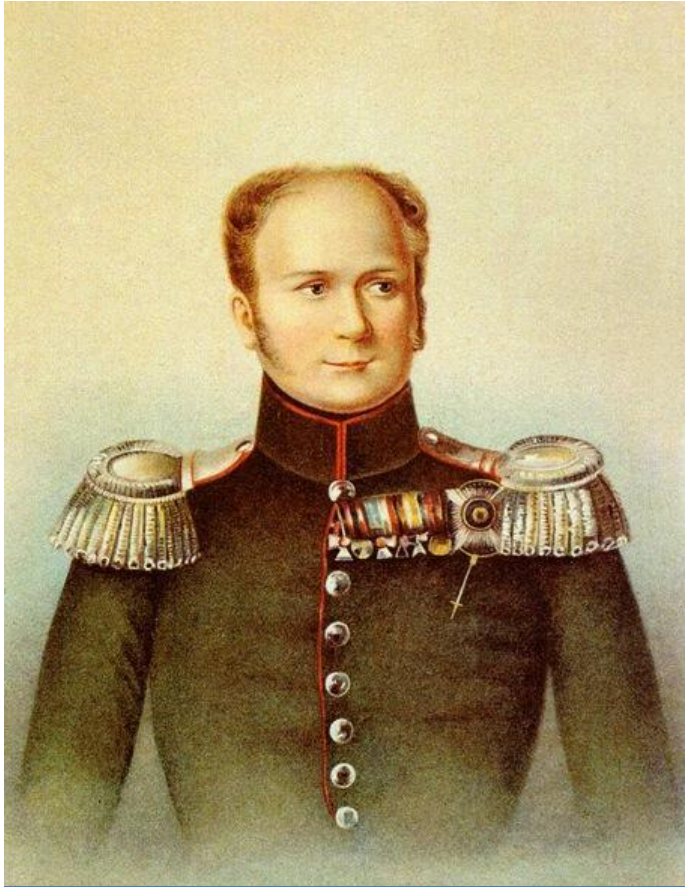
Александр 1 Павлович (1801-1825)

Александр I проводил либеральные преобразования: