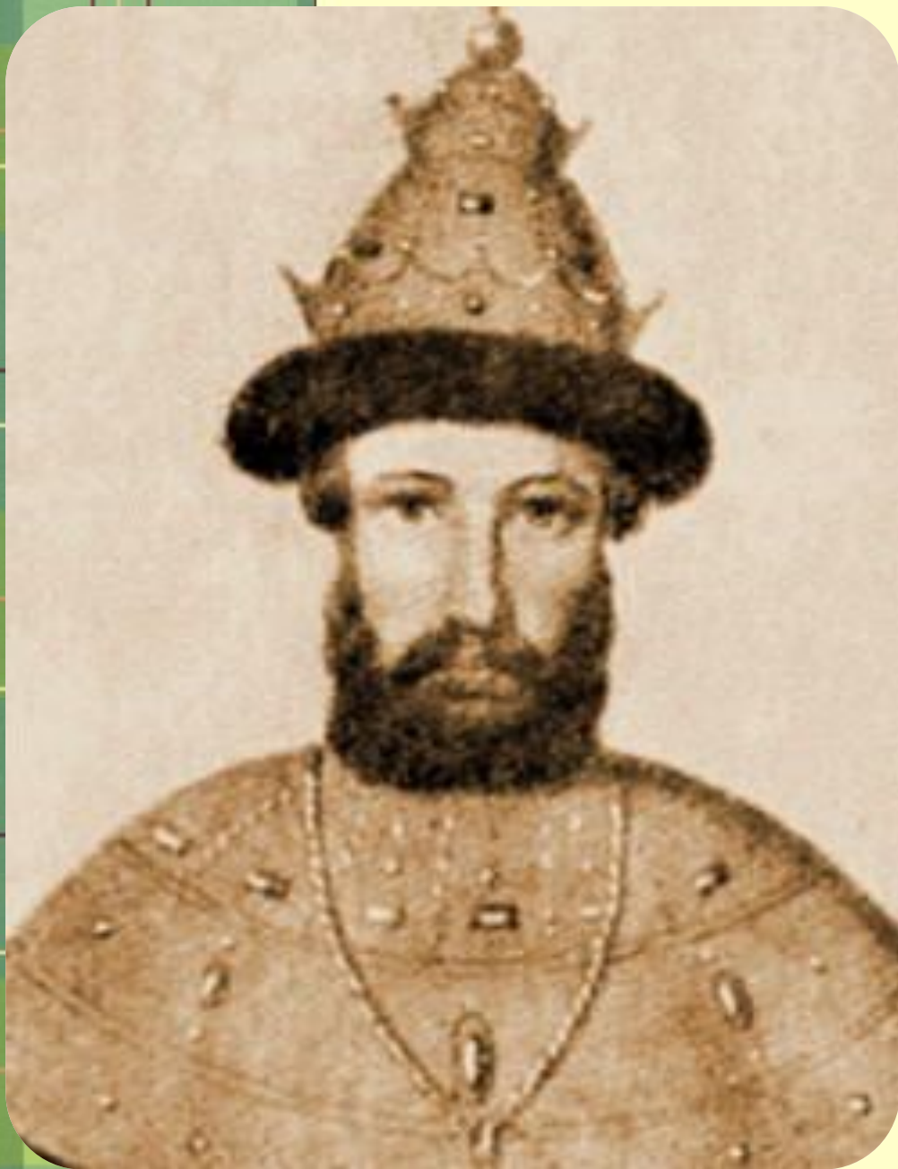
Василий II Тёмный (1425-1462)