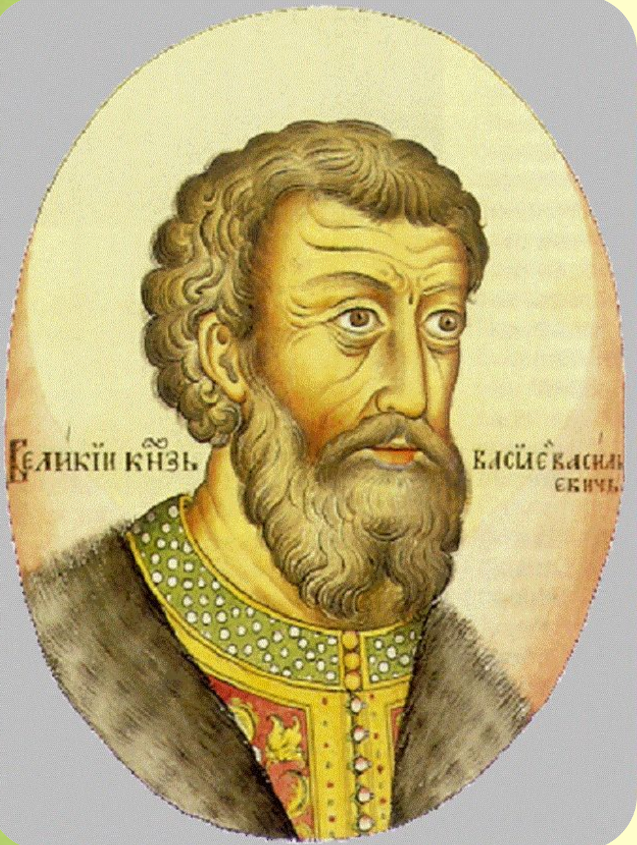
Василий I (1389-1425)