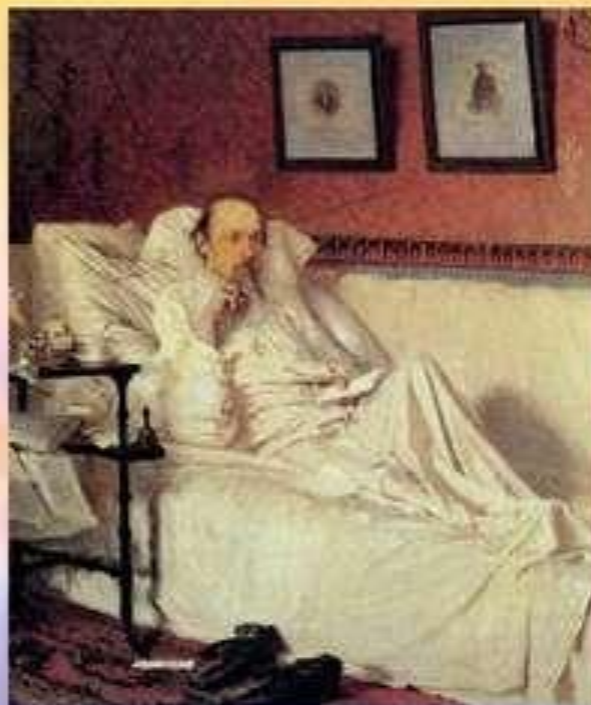
Н. Крамской. Портрет поэта Н. Некрасова.