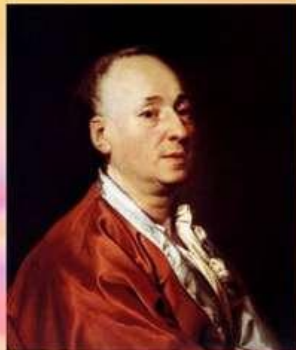
Д. Левицкий. Портрет Д. Дидро