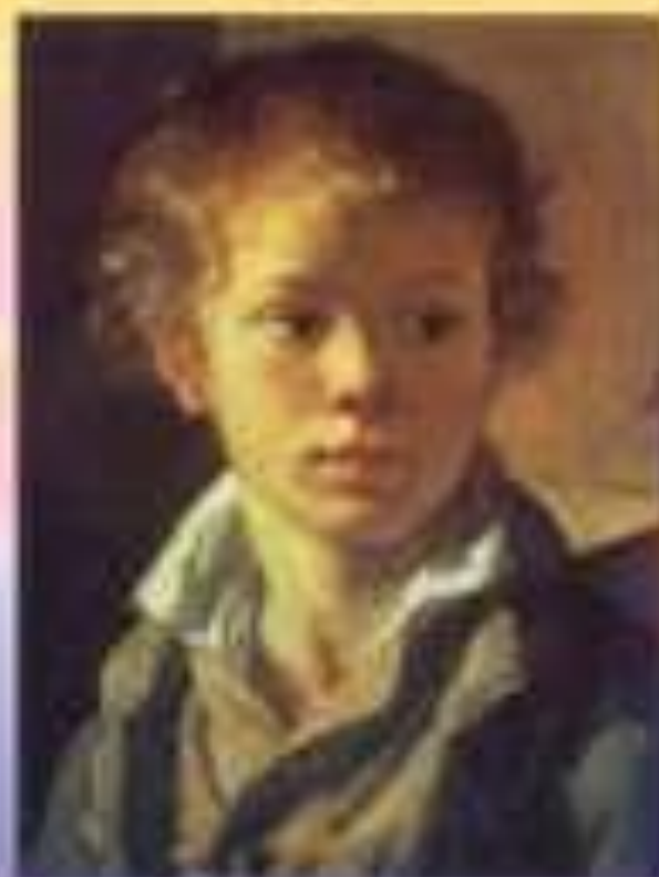
И. Трубичин Портрет мальчика