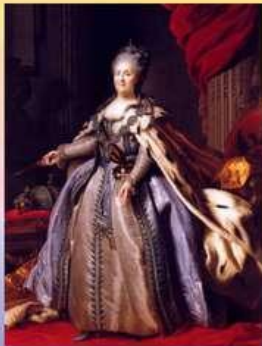
Ф. Рокотов. Портрет Екатерины II