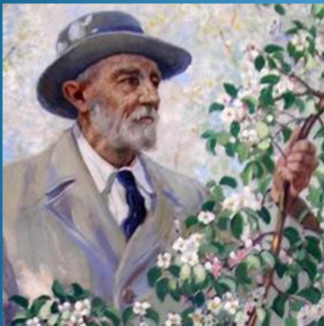
И. В. Мичурин

Новые сорта культурных растений создавали: