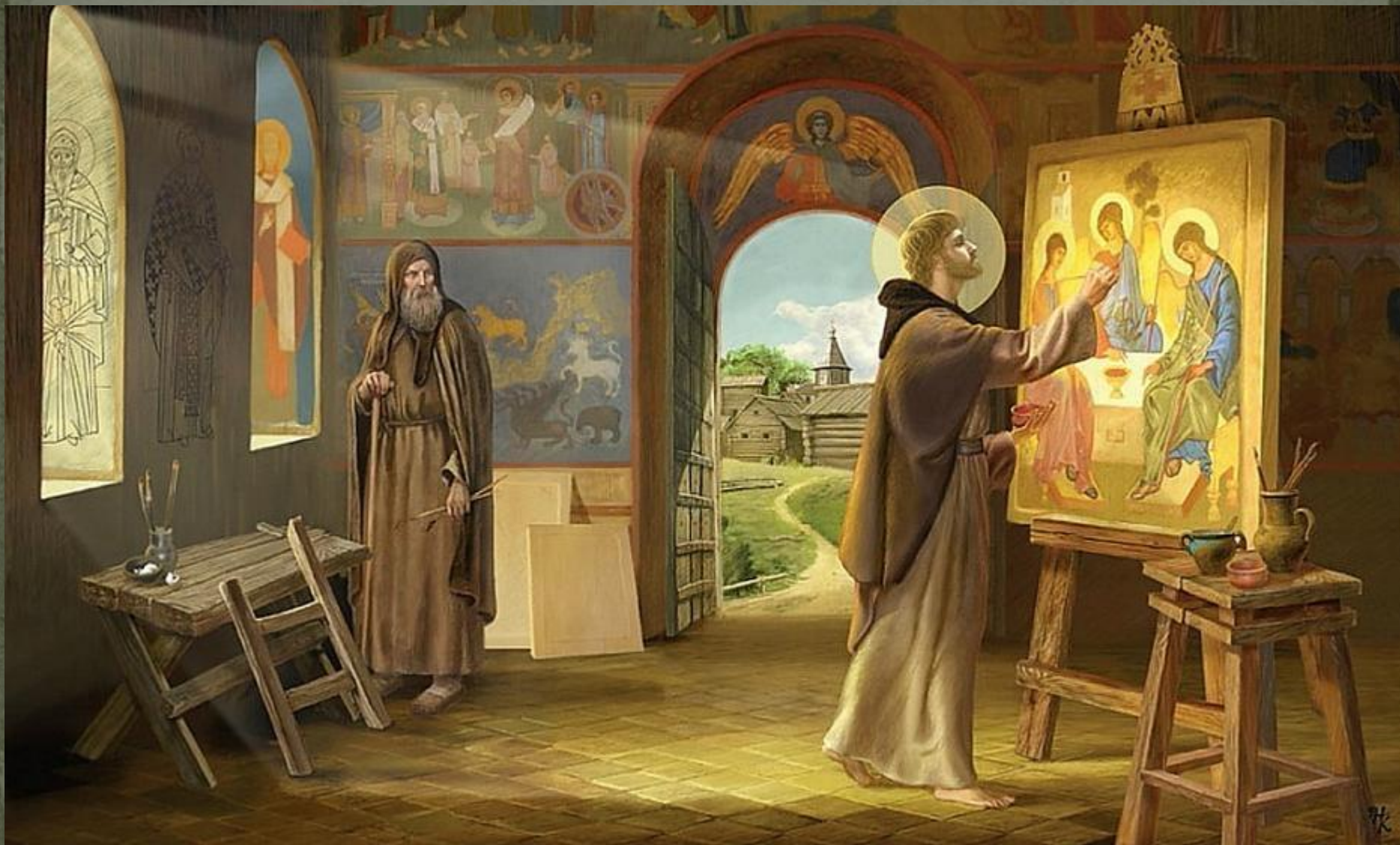
Преподобный Андрей Рублев