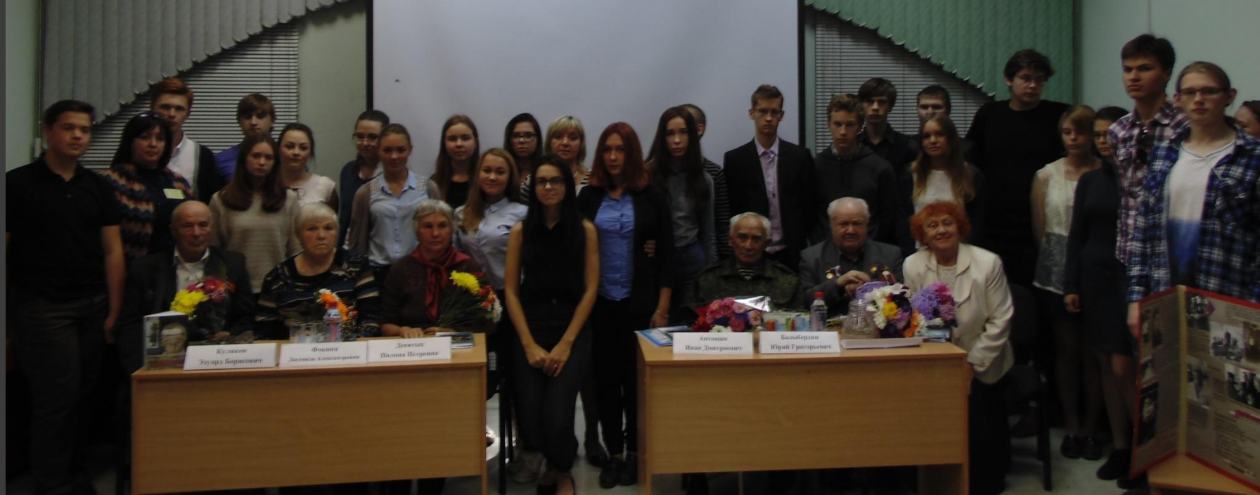
Фото на память о встрече