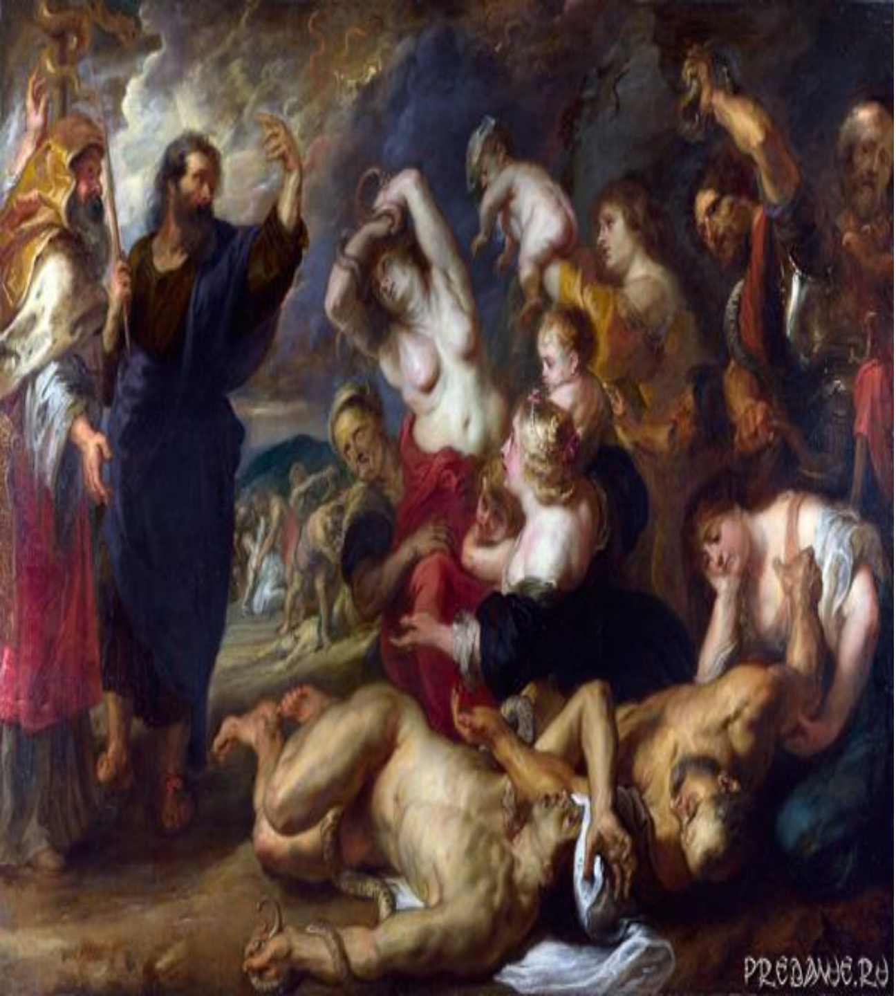
ВЕЛИКИЙ МАГ И ЧАРОДЕЙ.