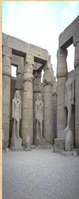
Храм бога Амона-Ра в Карнаке.

Храм состоял из: внутреннего двора, зала для религиозных процессий (гипостилья) и святилища. Стены храма украшались надписями и рисунками.