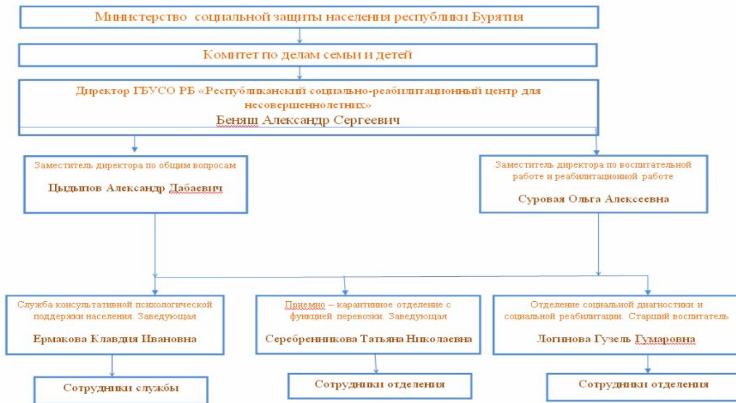
Схема структуры управления Государственного бюджетного учреждения социального обслуживания республики Бурятия «Республиканский социально-реабилитационный центр для несовершеннолетних»