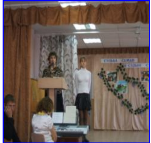
Форум «Судьба семьи в судьбе страны».