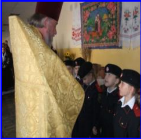
Форум «Кубань православная».