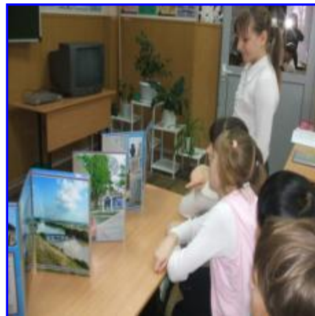
Изучение произведений духовной литературы, сбор материала к уроку «Образ храма в истории и литературе».