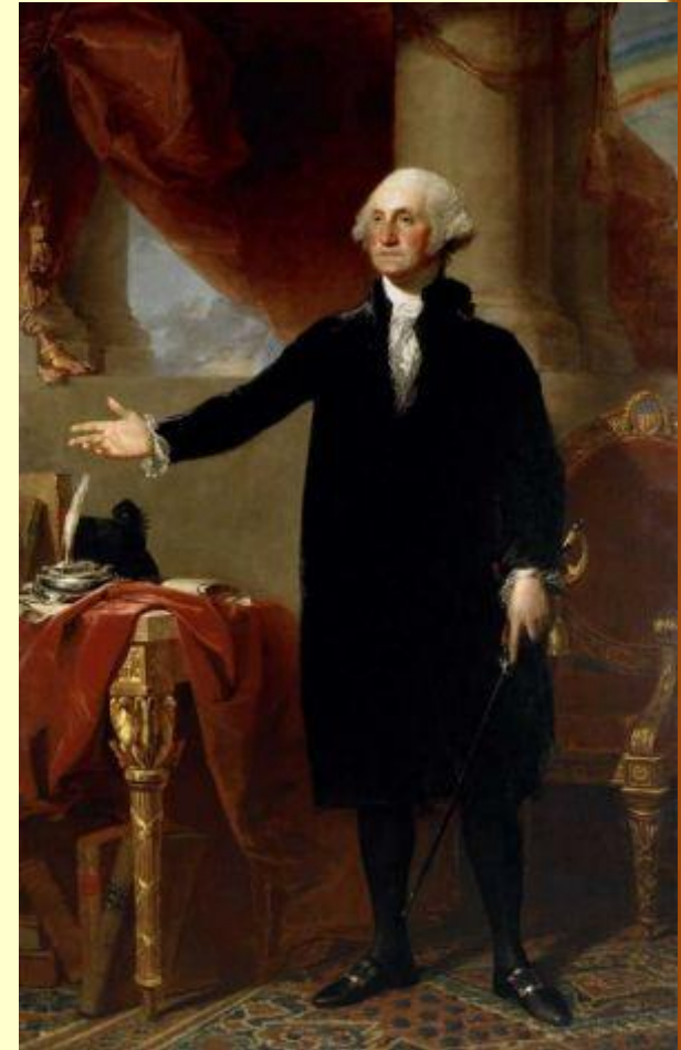
Первый президент – Джордж Вашингтон