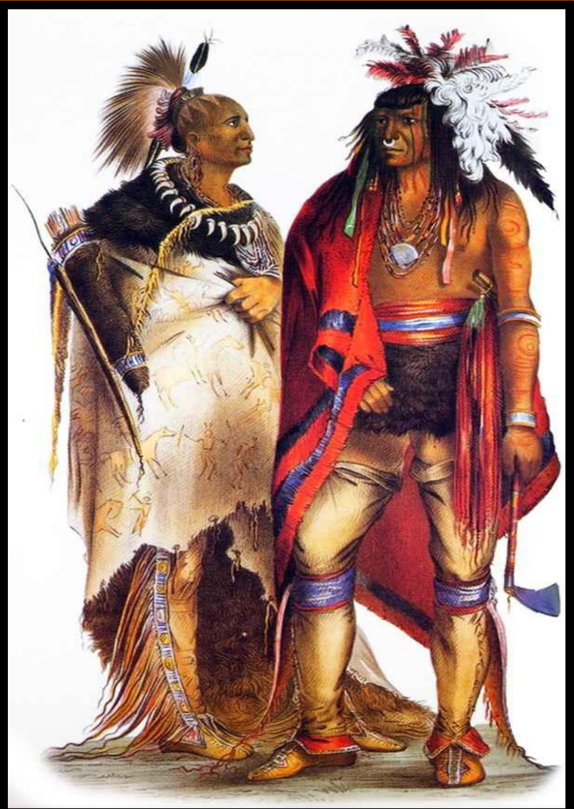
Ирокезы – воины

? Какую политику проводили переселенцы по отношению к индейцам, какую реакцию эта политика вызвала у индейцев?