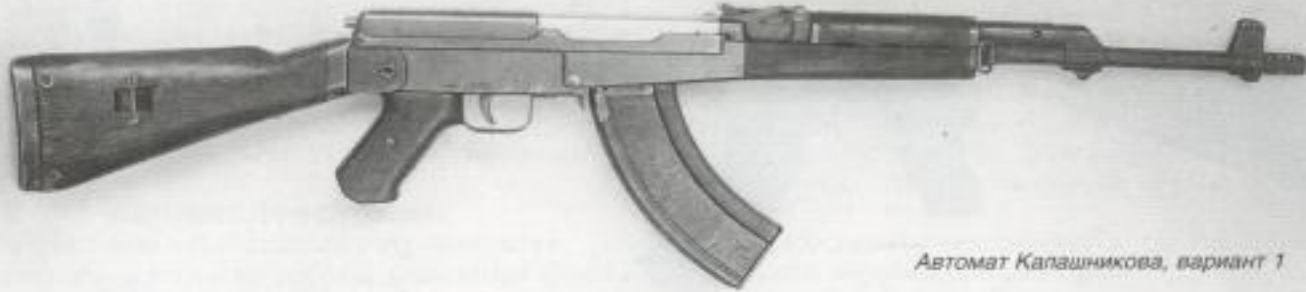
Автомат Калашникова, вариант 1