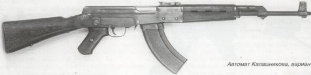
Автомат Калашникова, вариант 2

В 1947 году автомат Калашникова побеждает в конкурсе и принимается на вооружение.