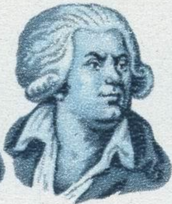
Ж. Ж. ДАНТОН