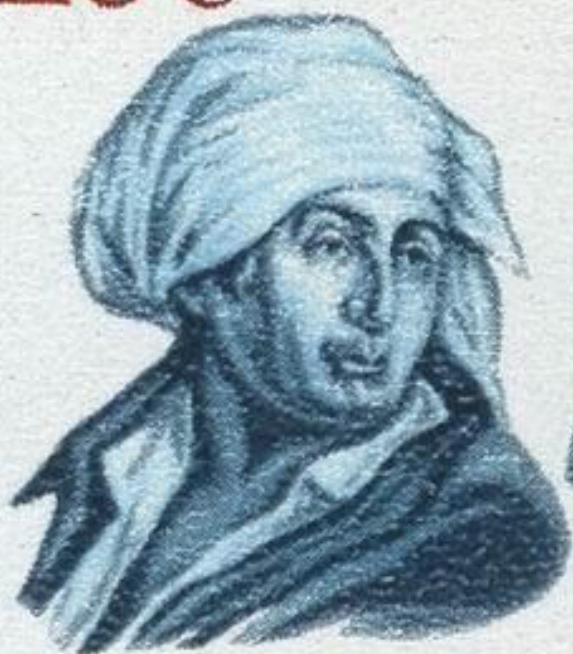
Ж. П. МАРАТ