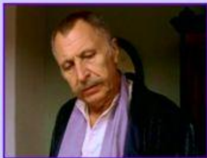
Павел Петрович Кирсанов

Отнёсся к Фенечке доброжелательно и воспринял выбор отца как должное. В сыне Фенечки не видит соперника-наследника.