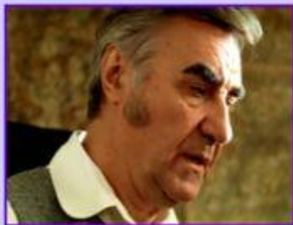
Николай Петрович Кирсанов

Любит Фенечку по-отечески нежно и преданно, счастлив от того, что имеет от неё сына.