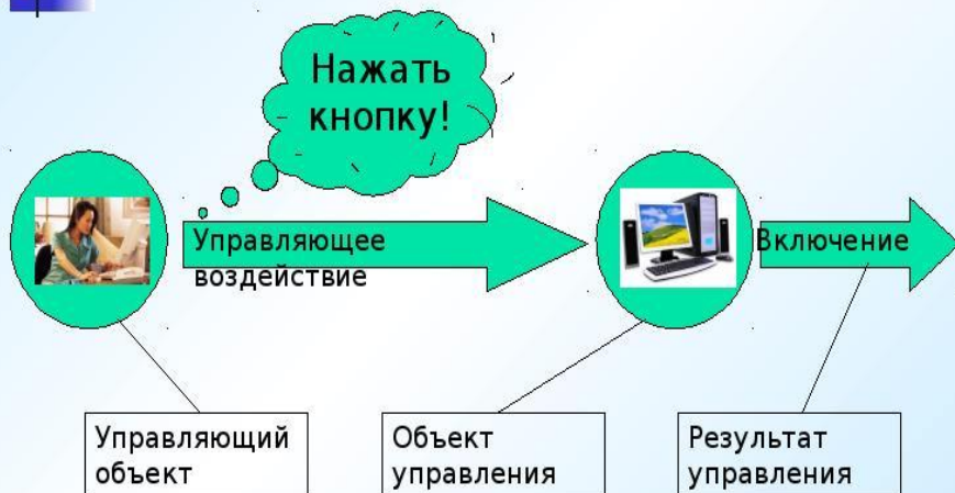
Схема управляющего воздействия человека на компьютер

предполагает собою взаимодействие следующих функций: планирование, организация и мотивация; Пример: руководитель принимает конкретный вид решения (формирует цель), затем планирует организационную структуру для выбранного плана, затем реализует его план, мотивируя работников повышением заработной платы или дополнительными выплатами