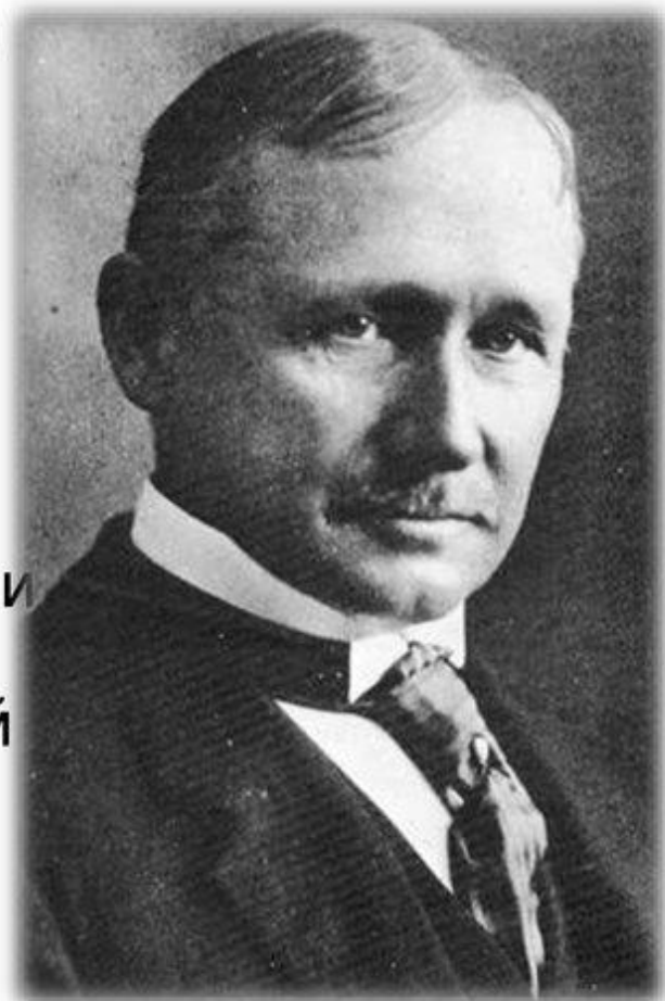
Фредерик Уинслоу Тейлор (1856-1915)