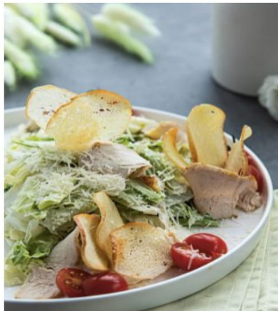
Цезарь с курицей

Куриная грудка, Дорблю, бекон, панировка, масло, зелень – 240 г