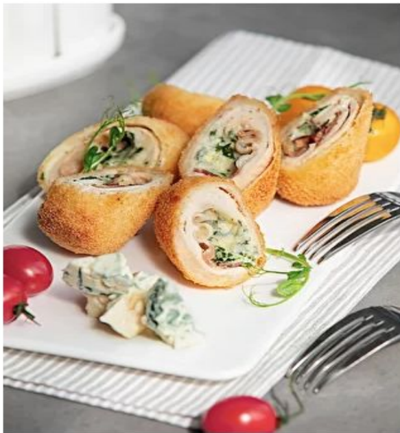
Формаджино (3 шт)

Куриная грудка, Дорблю, бекон, панировка, масло, зелень – 240 г