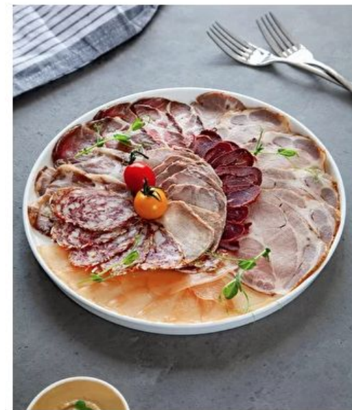
Плато мясной нарезки Евро

Салат, курица, пармезан, черри, сухарики, соус цезарь – 300 г