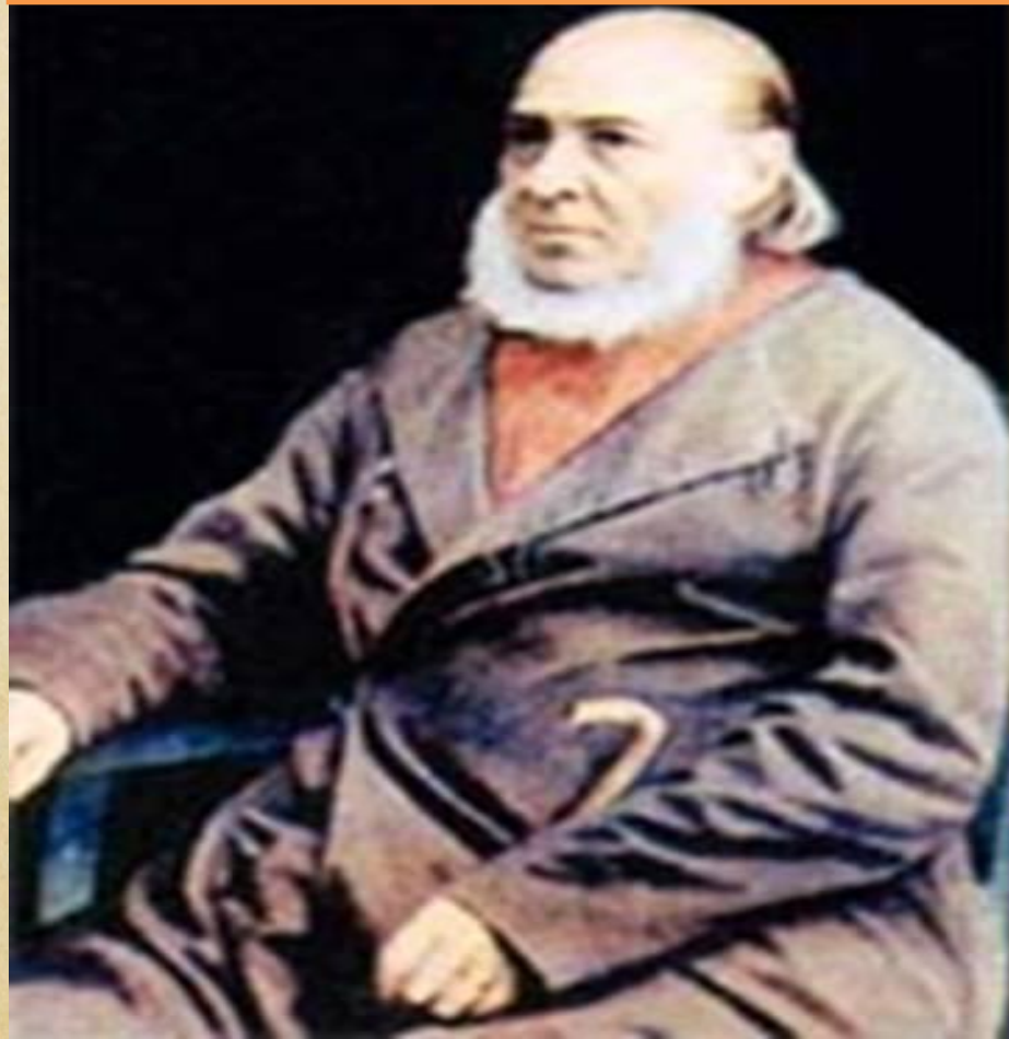
АКСАКОВ СЕРГЕЙ ТИМОФЕЕВИЧ (1791-1859ГГ)