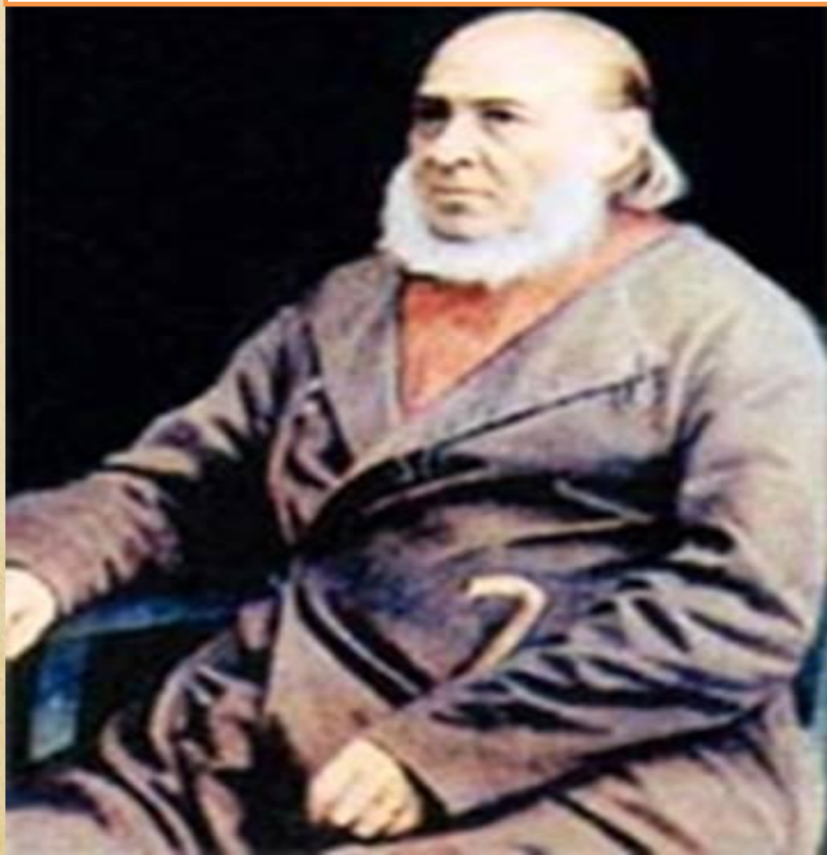
АКСАКОВ СЕРГЕЙ ТИМОФЕЕВИЧ (1791-1859ГГ)