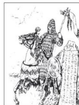
Ту көптігі көне түрік жауынгері Древнетюркский воин знаменосец.