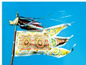
Көк түй түй Древнетюркское знамя