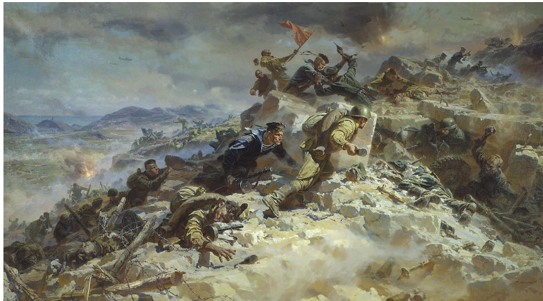
"Штурм Сапун-горы". Мальцев П.Т.