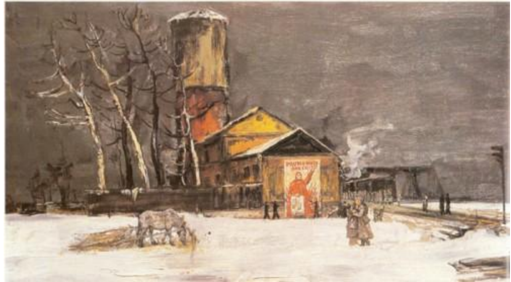
Г.К. Севостьянов "Тревожный 1941 год". 1982 г.