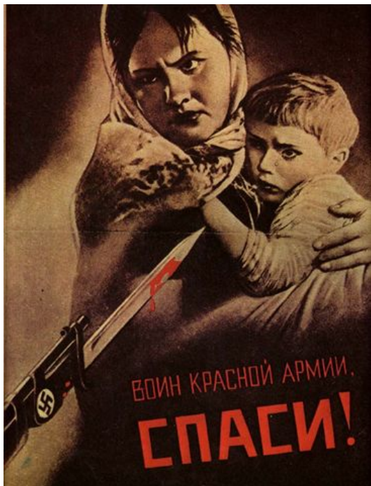
Плакат «Воин Красной Армии, спаси!». В.Г. Корецкий