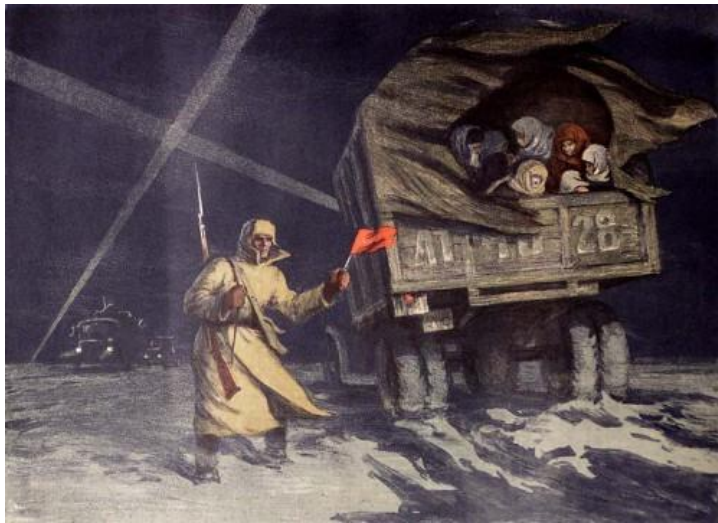
С. Боим "Ладога – дорога жизни". 1949 г.