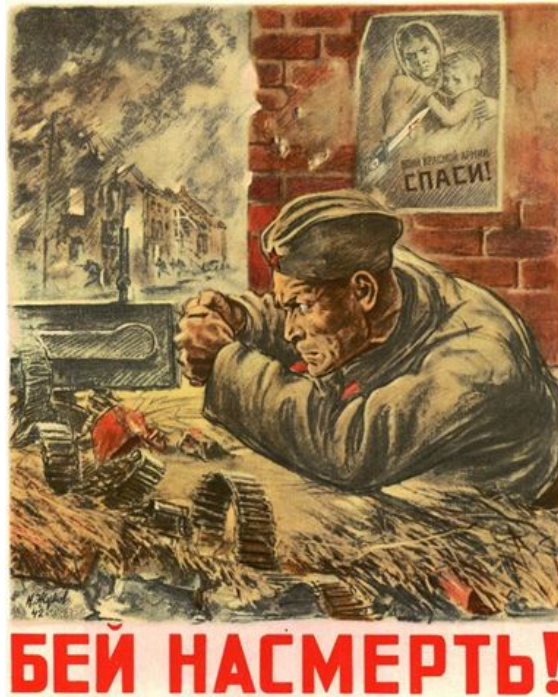
Плакат «Бей насмерть!». Автор неизвестен