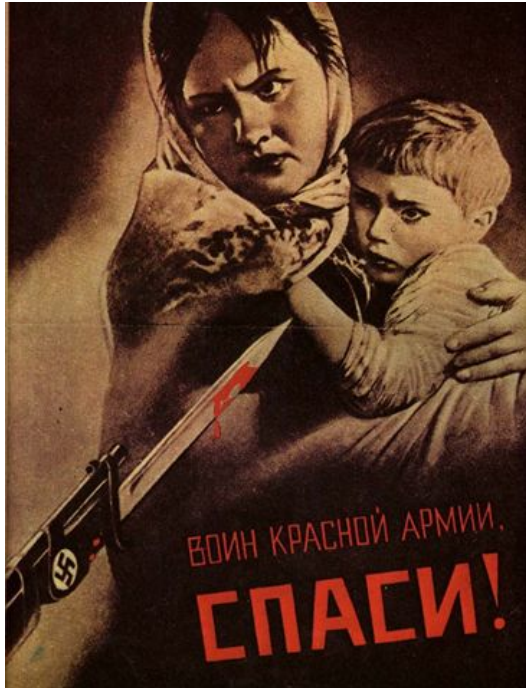
Плакат «Воин Красной Армии, спаси!». В.Г. Корецкий