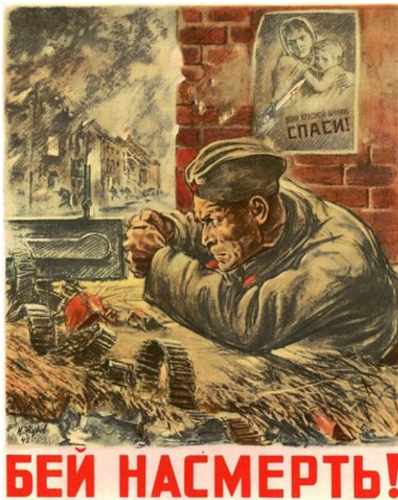
Плакат «Бей насмерть!». Автор неизвестен