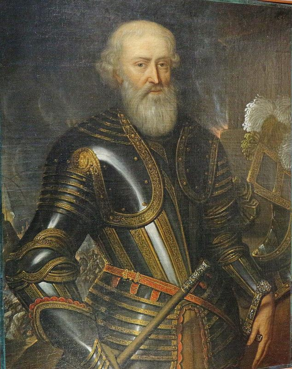
Борис Иванович Морозов (1590-1661)