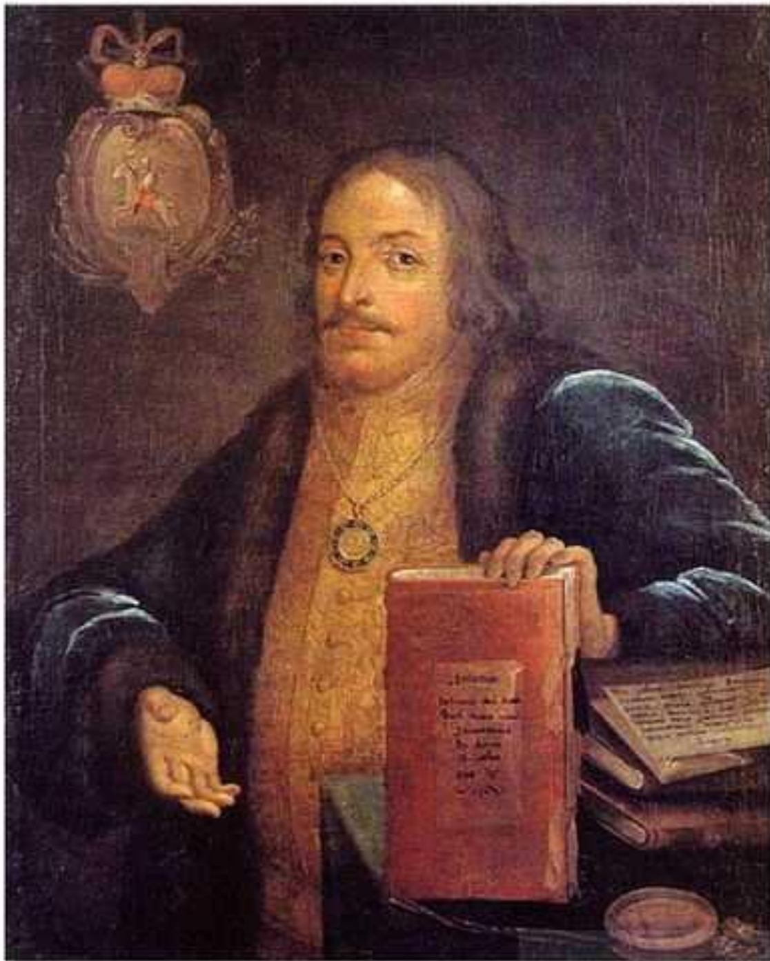
Василий Васильевич Голицын (1643-1714)