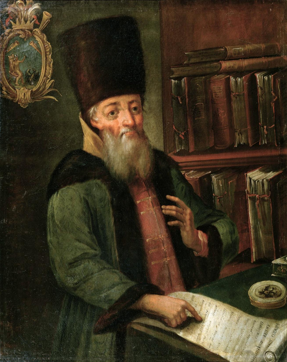
Афанасий Лаврентьевич Ордин- Нащокин (1605-1680)