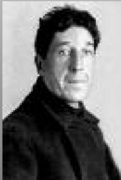
Игорь Северянин 1887-1941