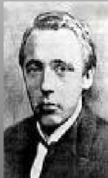
Велимир Хлебников 1885-1922