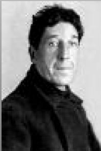
Игорь Северянин 1887-1941