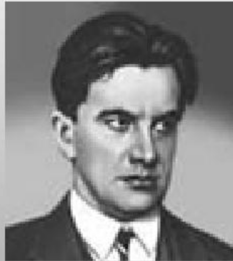
Бурлюк Давид Давидович 1882-1967