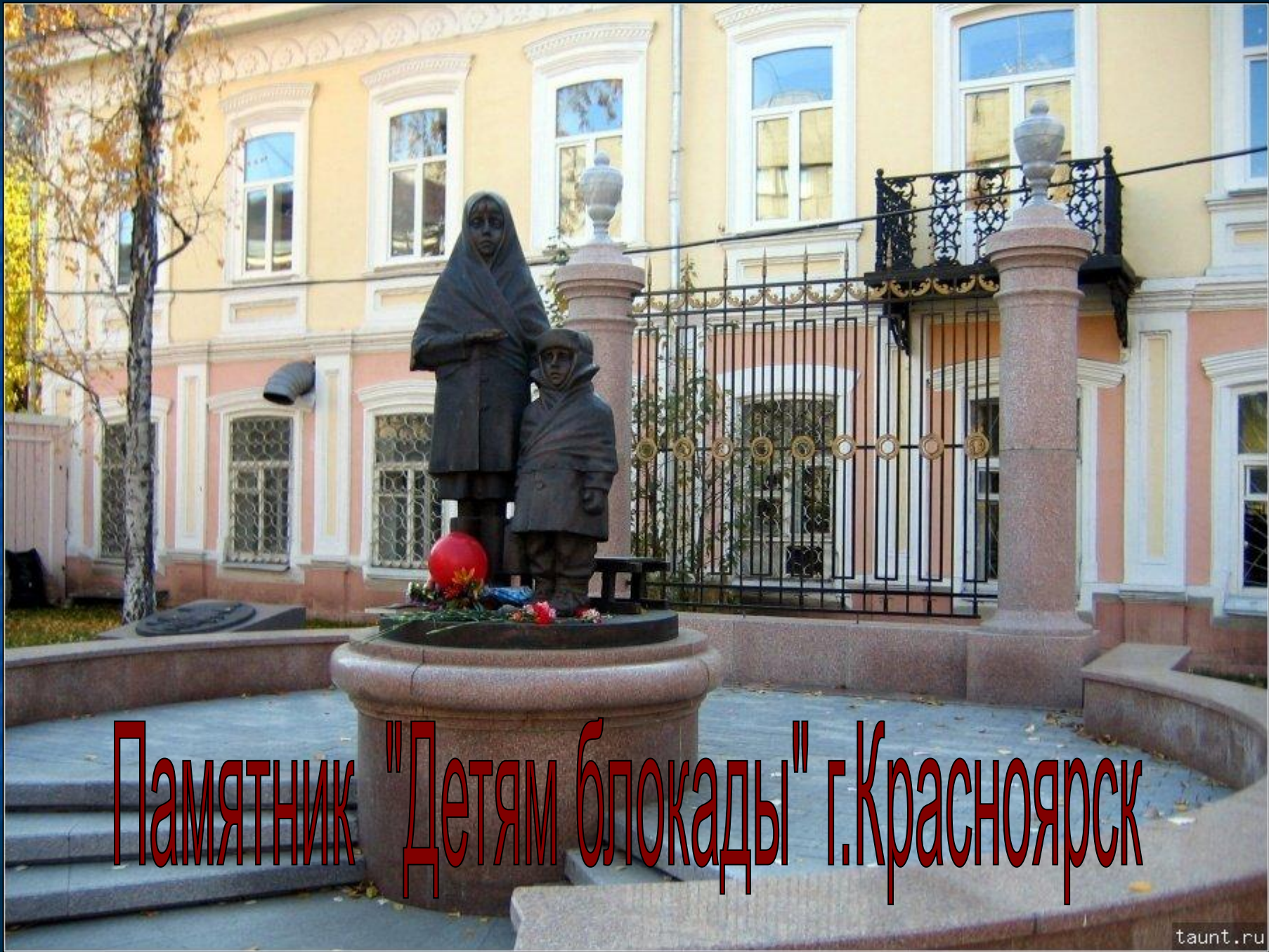
Памятник "Детям блокады" г. Красноярск