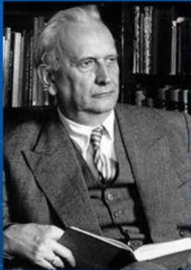
Карл Ясперс (1883-1969) – немецкий философ, психолог и психиатр

В будущем человечество ждёт единство мира, свободное общение, преобразование души человека, преодоление насилия