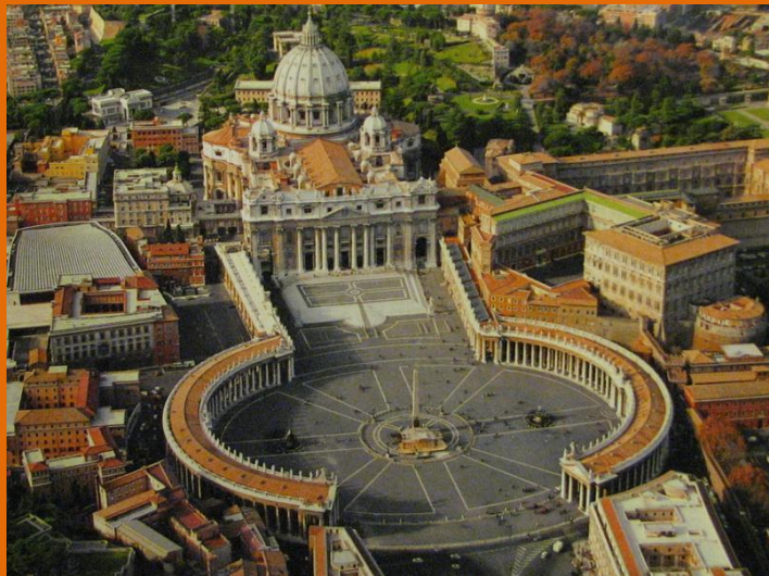
Собор св. Петра в

Архитектор, скульптор, живописец, декоратор