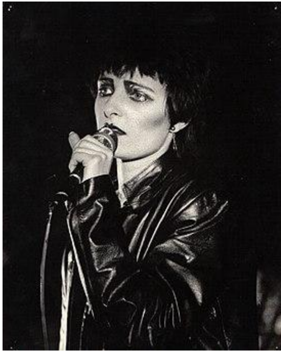
Сьюзен Джанет Баллион