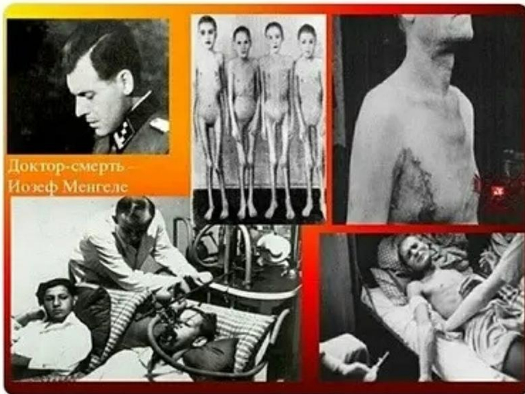
Доктор-смерть – Йозеф Менгеле