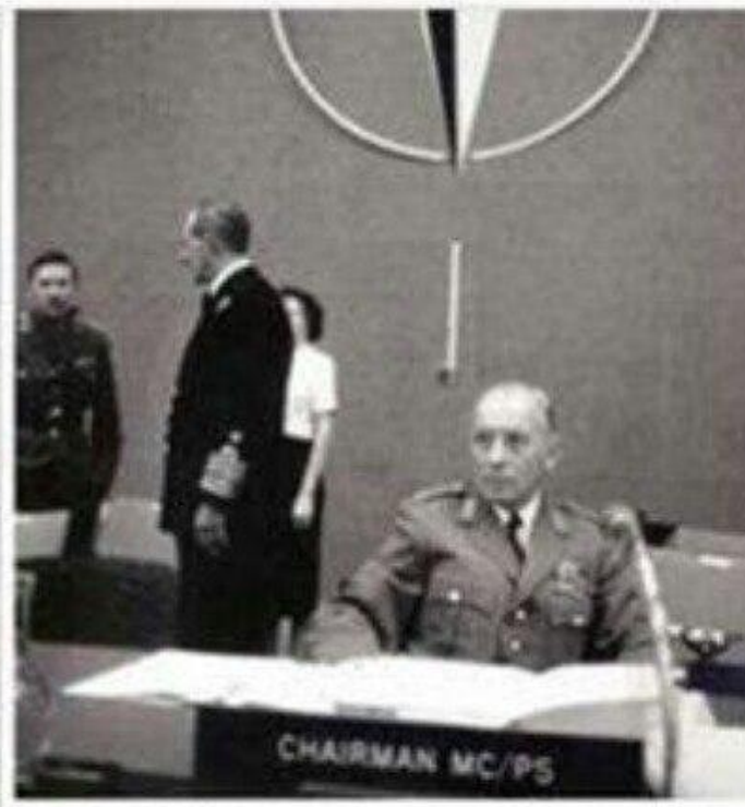
Hitler Nazi General and NATO Chairman