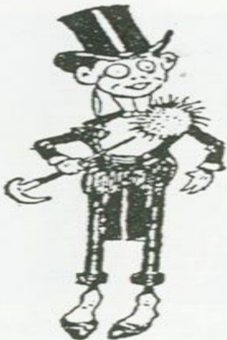
Так выглядел самый первый Мурзилка. Рис. П. Кокса