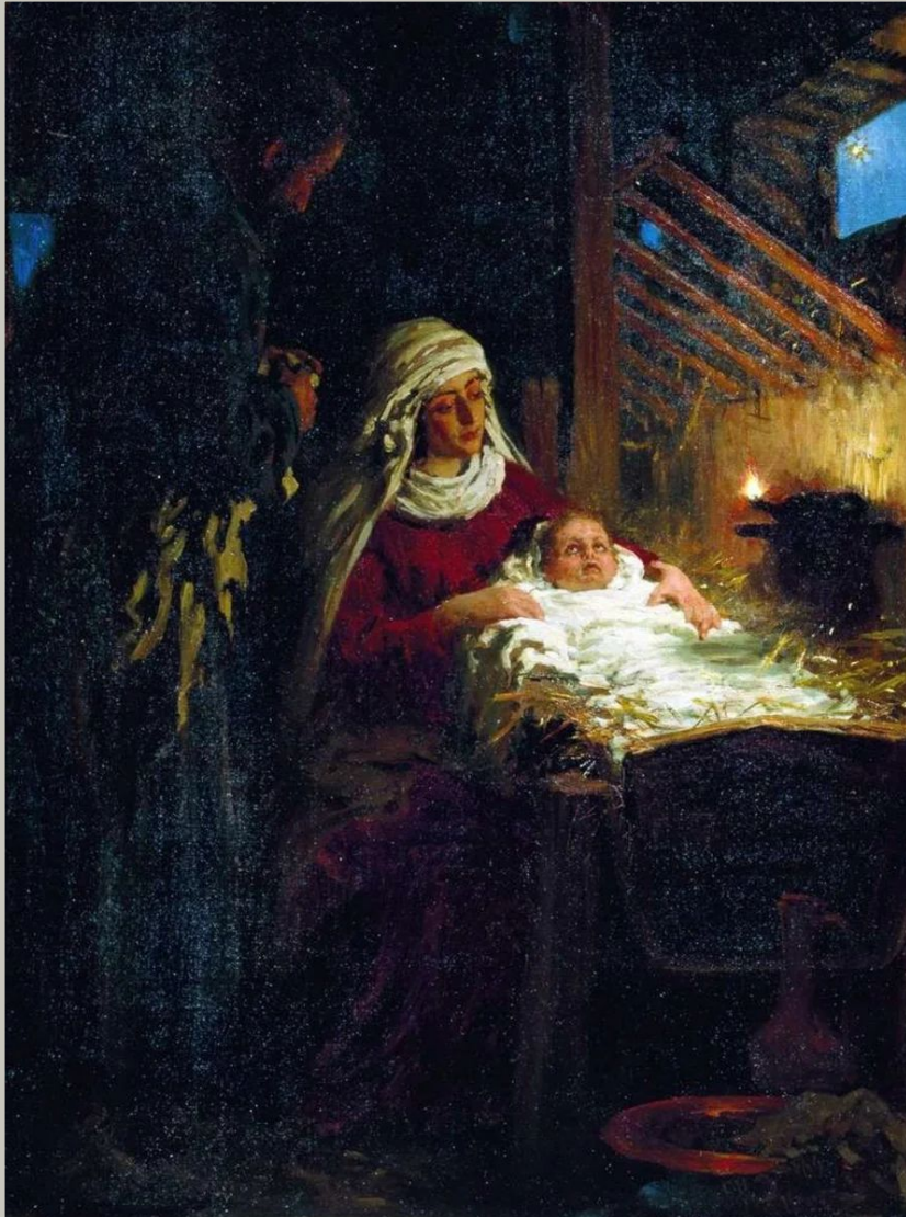
Илья Репин «Рождество Христово» (1844-1930)