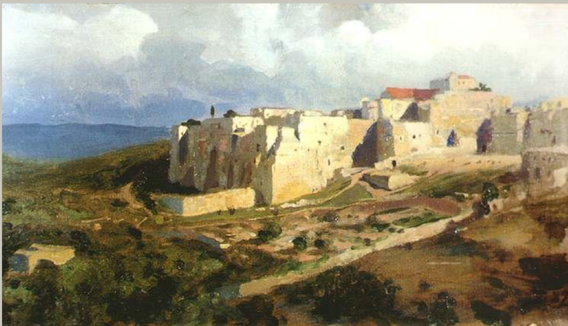
Вифлеем. Вид на Базилику Рождества. Василий Поленов. 1882 г. Акварель. Саратовский государственный художественный музей