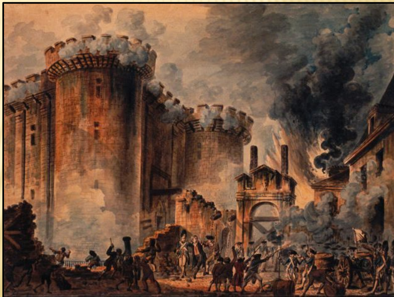
Взятие Бастилии 14 июля 1789