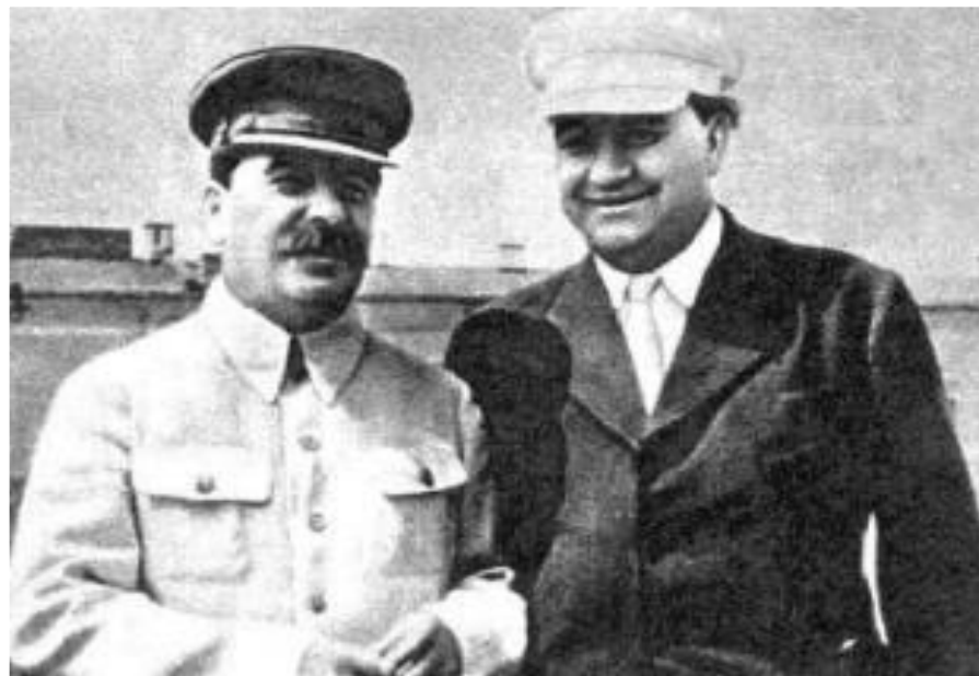
И.Сталин и Г.Димитров

С 1947 г. под давлением СССР ускорился процесс формирования коммунистических правительств в странах «народной демократии». В это же время установился коммунистический режим в С.Корее, а в 1949 г. в Китае. СССР оказывал им огромную материальную помощь, «привязывая» к себе. В 1949 г. был создан СЭВ, а в 1955 г. Организация Варшавского Договора. Кроме того коммунисты оказались у власти во Франции и в Италии.