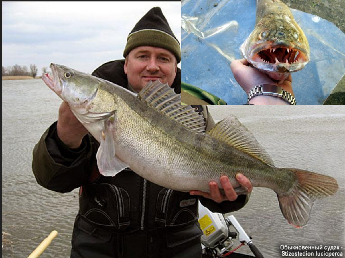
Обыкновенный судак - Stizostedion lucioperca

вид лучепёрых рыб из семейства окунёвых. Рыба крупных размеров. Некоторые особи вырастают длиной более одного метра, при этом вес судака может составлять 20 кг, но в среднем масса рыбы варьируется от 10 до 15 кг. Характерная особенность - наличие на челюстях крупных клыкообразных зубов. Питается рыбой, а мелкие особи также поедают водных беспозвоночных. Весьма чувствителен к концентрации кислорода в воде. В тёплое время года держится на глубинах 2—5 м. Активен как днём, так и ночью.