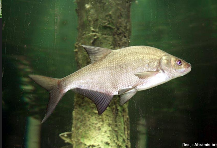
Лещ - Abramis brama

- единственный представитель рода лещей ( Abramis ) из семейства карповых ( Cyprinidae ). Окраска леща зависит от особенностей водоемов: в одних - бока серебристо-темноватого оттенка, в других - серебристо-желтоватого. Плавники темносерые; спинной - короткий и высокий, предхвостовой — длинный и узкий. Такого высокого тела, как у леща, нет ни у одной пресноводной рыбы. Максимальная длина тела 82 см, масса 6 кг, максимальная продолжительность жизни — 23 года. Донная рыба. Питается он главным образом разными водяными личинками, всевозможными рачками, но в основном — мотылем, не брезгует и молодыми побегами водорослей.