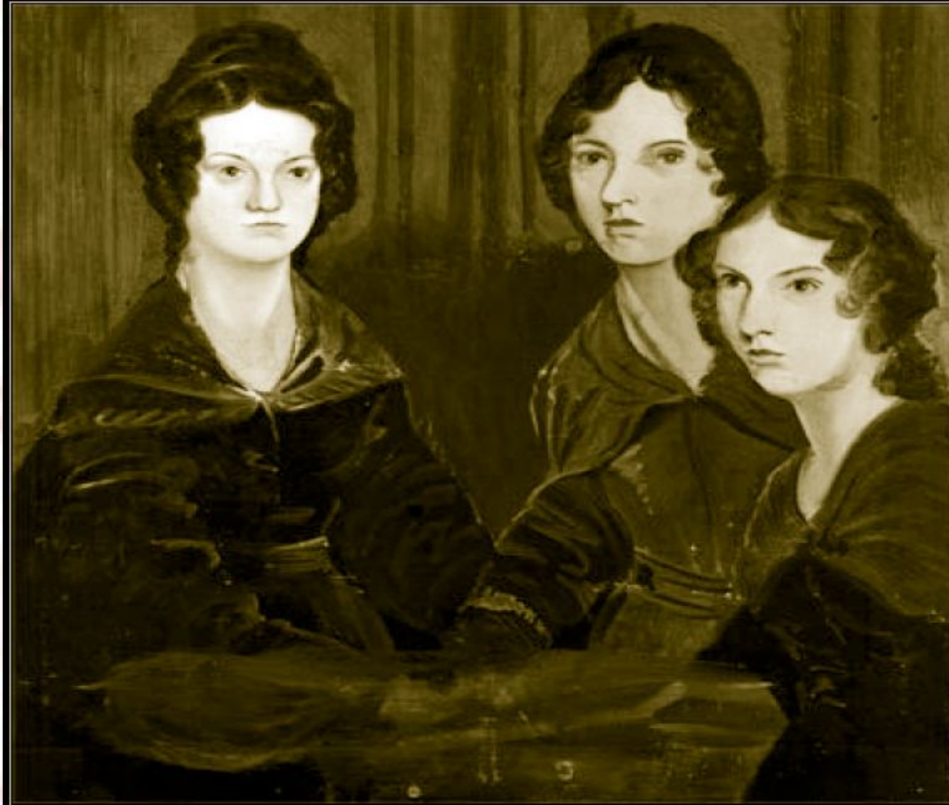
Шарлотта, Эмили и Энн Бронте