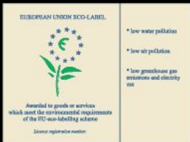
Рис. 2 "Эко-знак" (ЕС)