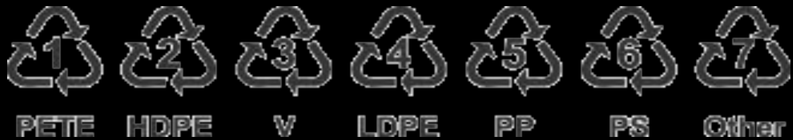
Рис. 8 Идентификационная маркировка пластиков SPI (США)