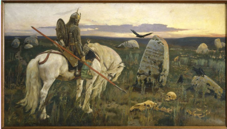
В. Васнецов "Витязь на распутье"