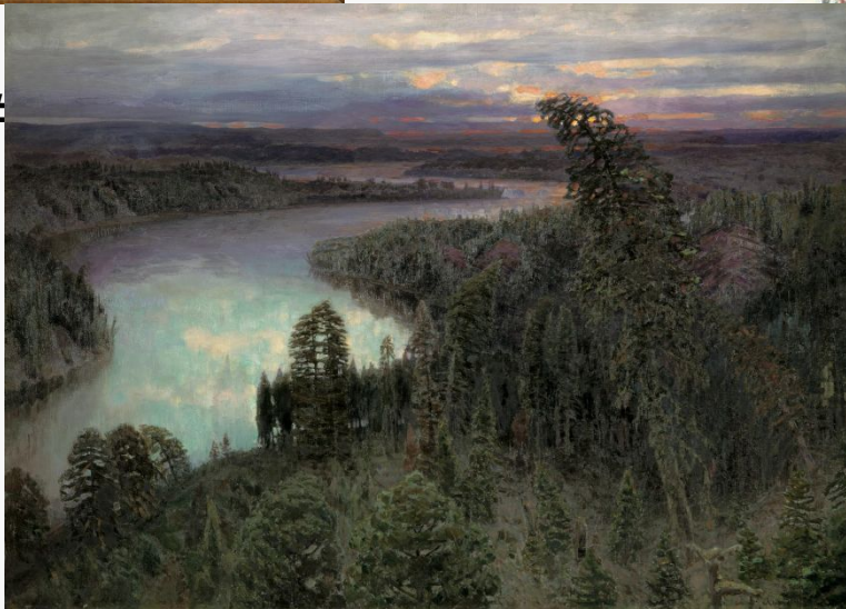
А. Васнецов "Северная земля"