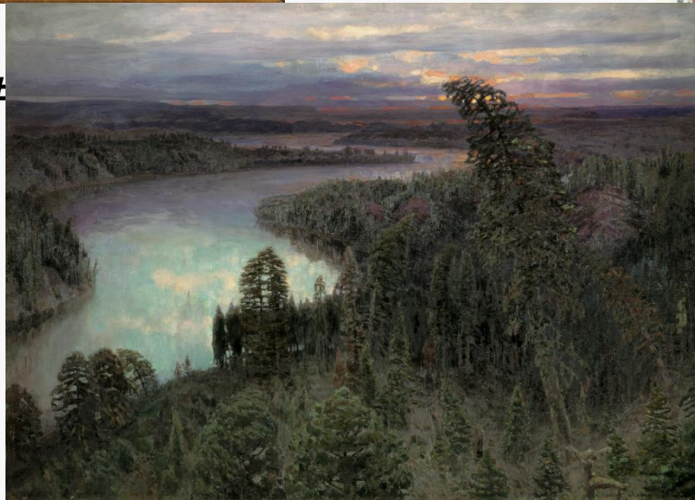
А. Васнецов "Северная земля"