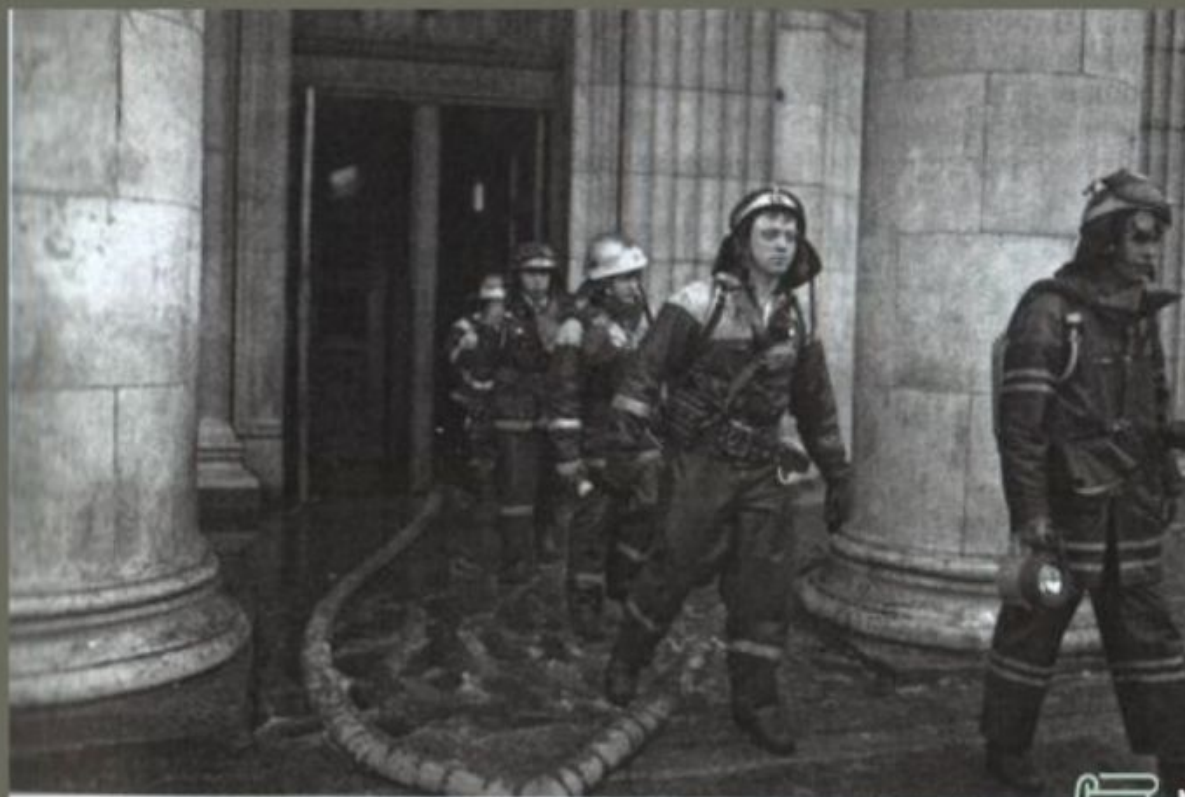
Современный пожарный расчет выходит после ликвидации пожара из метро «Новосло- вдская». К пожару привело возгорание кабеля

В настоящее время в Российской Федерации пожарная охрана - это большая и сложная структура. Основная ее часть - Федеральная противопожарная служба , которая входит в состав МЧС России.