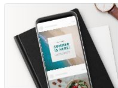
Публикация в Instagram