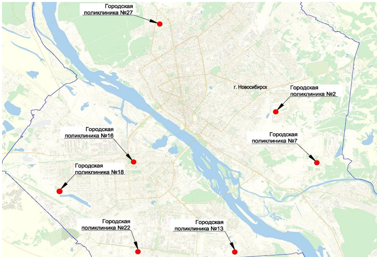
СХЕМА РАСПОЛОЖЕНИЯ ГОРОДСКИХ ПОЛИКЛИНИК НА ТЕРРИТОРИИ ГОРОДА НОВОСИБИРСКА

Условные обозначения: - часть границы города Новосибирска - обозначение городских поликлиник