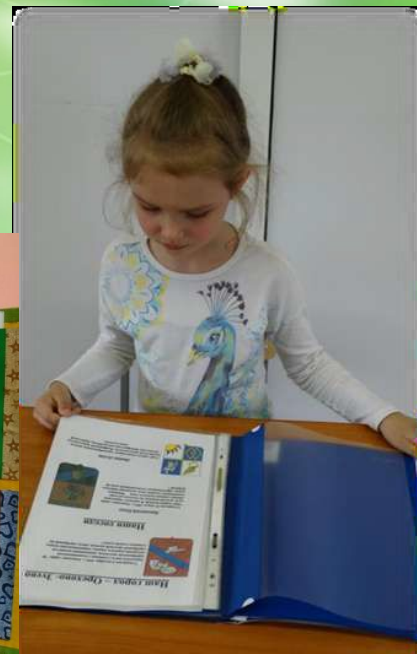
Создание лэпбука «Берегите природу»