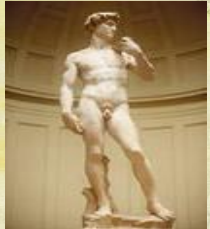
Статуя Давида Микельанджелло Б.