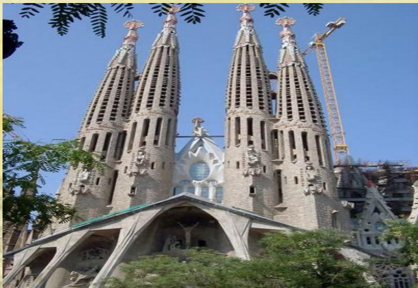
Саграда Фамилия Архитектор А Гауди

Архитектура — искусство проектировать и строить здания и другие сооружения (также их комплексы).