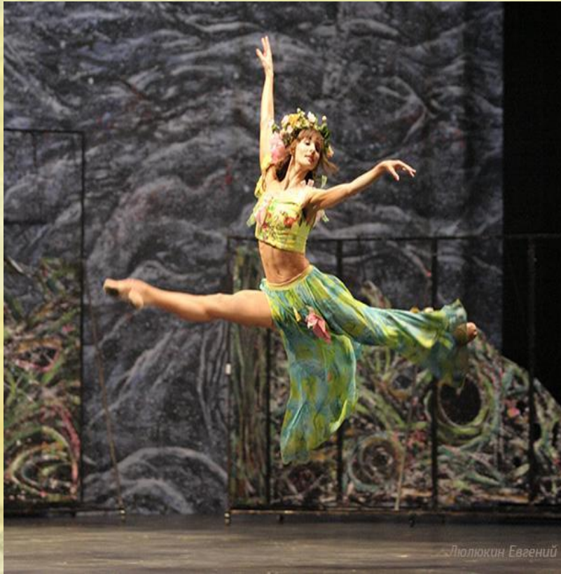
"Балет Кармина Бурана».

Балет - вид искусства, содержание которого раскрывается в танцевально-музыкальных образах.