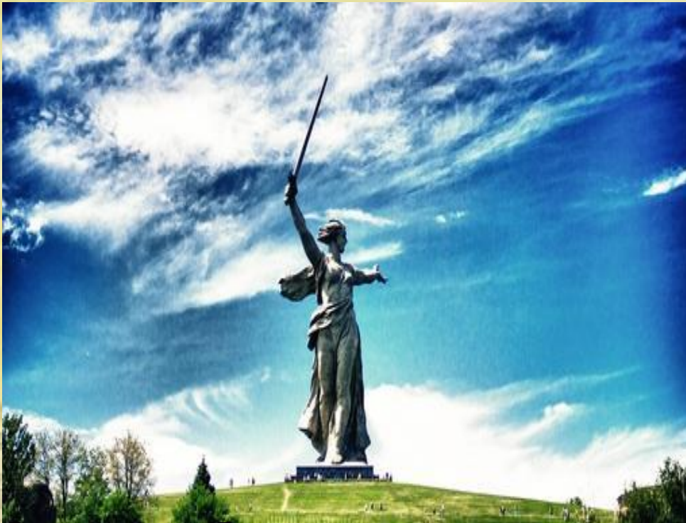
Статуя работы скульптора Вучетича Е.В. «Родина- Мать зовет»

Скульптура - вид изобразительного искусства — создание объемных изображений путем лепки, высекания, резания или отливки.