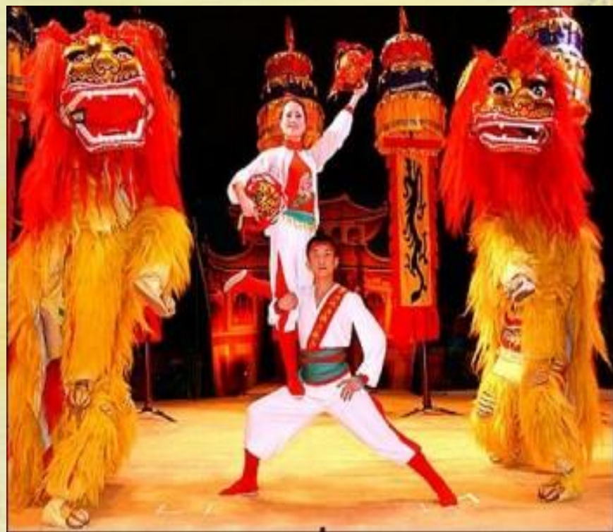
Национальный цирк Китайской Народной Республики