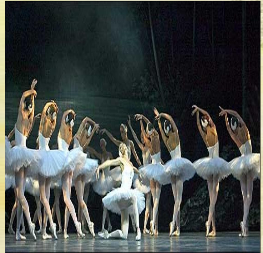
П.И. Чайковский «Лебединое озеро».