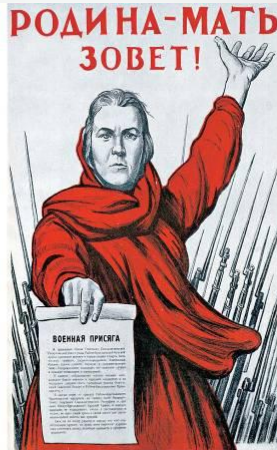
Плакат «Родина-мать зовёт!» Художник И.М. Тоидзе. 1941 г.