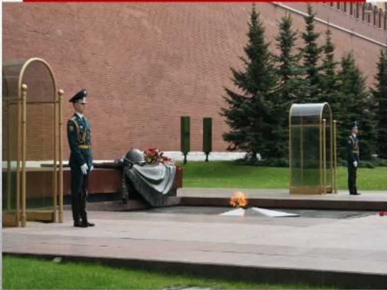
ПОСТ №1 Почётного караула у Памятника Неизвестному Солдату. г. Москва

В России всем от мала до велика известна могила Неизвестного солдата у красной стены Московского Кремля. Это одно из значимых мест нашей страны. К мемориалу во время всех государственных праздников торжественно возлагают цветы первые люди государства и высокие гости столицы, сюда стремятся многочисленные туристы и москвичи возложить цветы и посмотреть развод Почетного караула на Посту №1.