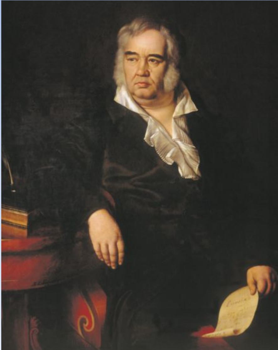
Иван Андреевич Крылов

Люблю, где случай есть, пороки пощипать.